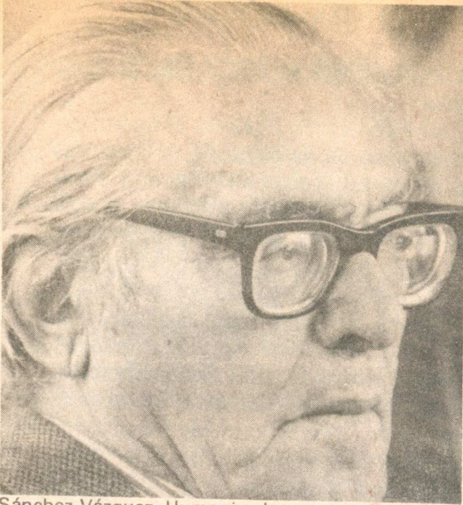
Sánchez Vázquez. Humanizarlo